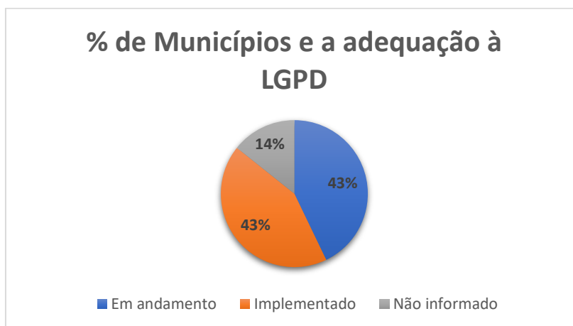
Gráfico 2: Porcentagem de Municípios x a adequação a LGPD