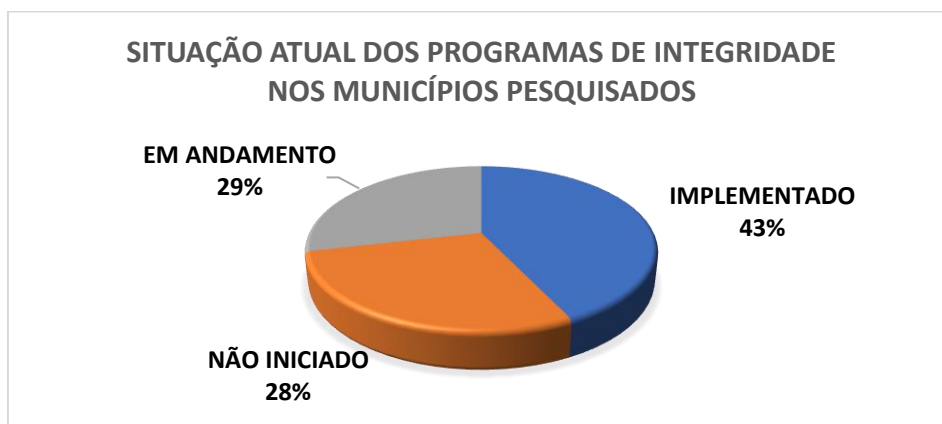
Gráfico 1 - Distribuição da situação atual dos Programas de Integridade nos municípios pesquisados

Em relação à situação dos municípios quanto à execução dos programas de integridade, a pesquisa demonstrou a seguinte distribuição: