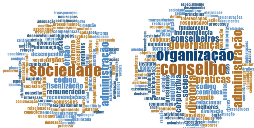
Figura 3. Código de Boas Práticas - IPCG X IBGC

Uma outra análise buscou comparar o conteúdo dos códigos de boas práticas de cada país, relacionando e identificando semelhanças e divergências entre eles, através da contagem de palavras. Na figura 3 é possível apreciar os comparativos (nuvem de palavras dos códigos de boas práticas). A figura apresenta as palavras que mais descreve o instituto como no IPCG: sociedade, administração, órgão, código, fiscalização, governo, remuneração, executivos, desempenho, membros, recomendações, riscos, comissões, princípio, informação. No caso do IBGC as palavras são: conselho, organização, administração, diretoria, governança, práticas, conselheiros, sócios, corporativa, código, auditoria, controles, comitê, independência, presidente. Nesta observação, e pela leitura dos códigos, percebe-se que o IPCG buscou direcionar seu código de boas práticas às empresas listadas em bolsa de valores. Isto é muito mais atrelado ao aspecto institucional. O IBGC procurou deixar seu código de boas práticas aberto a todos os tipos e tamanhos de empresas, com um maior detalhamento dos princípios que o norteiam. Um enfoque mais voltado para o aspecto educacional.