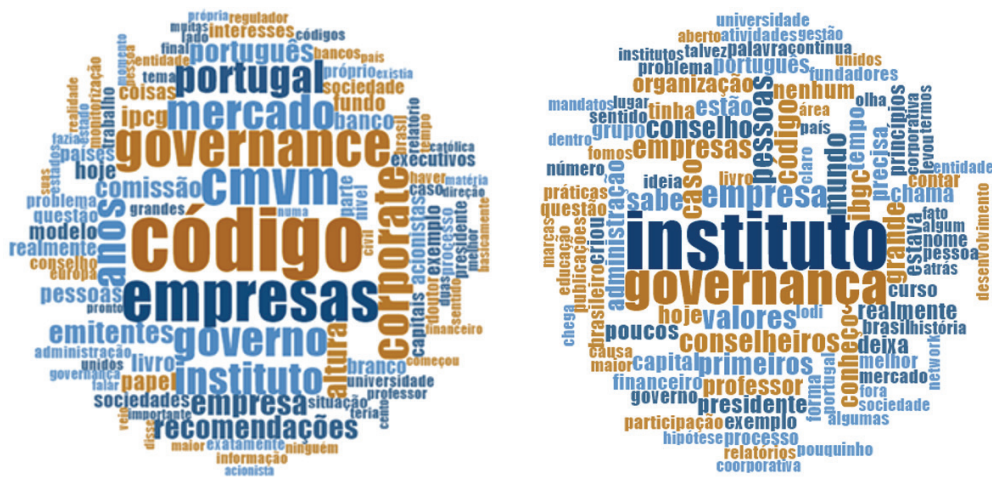
Figura 2. Nuvem de Palavras das entrevistas realizadas – Portugal X Brasil