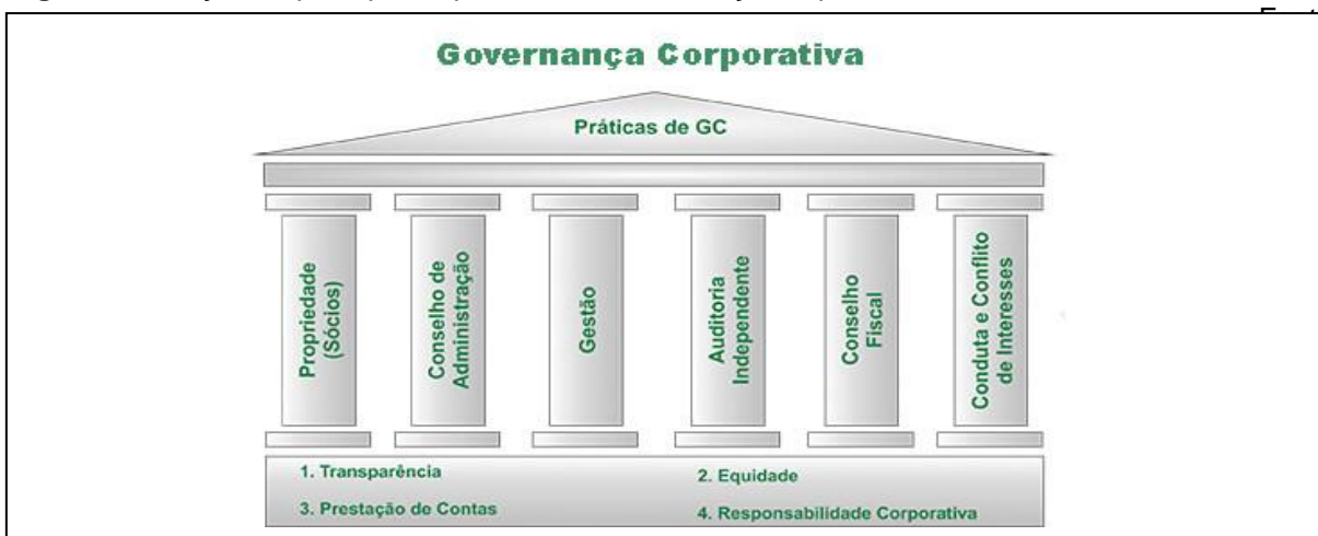
Figura 1- Relação de princípios e práticas da Governança Corporativa:

Desta forma na figura 1, pode-se observar a visão de sustentabilidade na relação dos princípios básicos com os pilares de sustentação da Governança Corporativa: